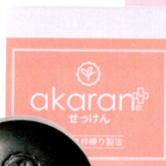
アカランプラス メディカルソープ ¥1,680