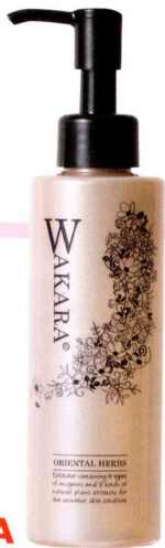
角質ポロポロ ジェル 和から ¥1,500